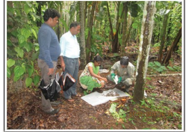
50 ಗ್ರಾಂ ಟ್ರೈಕೋಡೆಮಾ ವಿರಿಡೆ ಶಿಲೀಂಧ್ರವನ್ನು 1 ಕಿ. ಗ್ರಾಂ ಬೇವಿನ ಹಿಂಡಿ ಮತ್ತು 5 ಕಿ.ಗ್ರಾಂ ಕೊಟ್ಟಿಗೆ ಗೊಬ್ಬರದಲ್ಲಿ ಮಿಶ್ರಣ ಮಾಡುವುದು