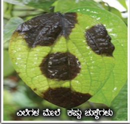
ಎಲೆಗಳ ಮೇಲೆ ಕಪ್ಪು ಚುಕ್ಕೆಗಳು